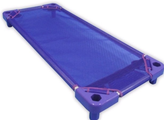
MODELO: ITEM 01